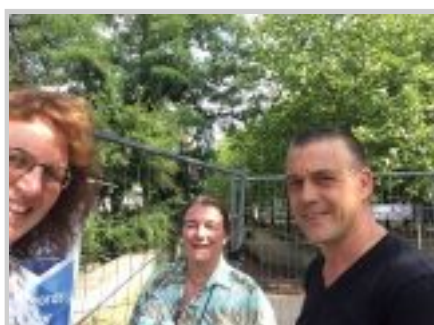
Wachten tot de "anti kraak" het hek opent