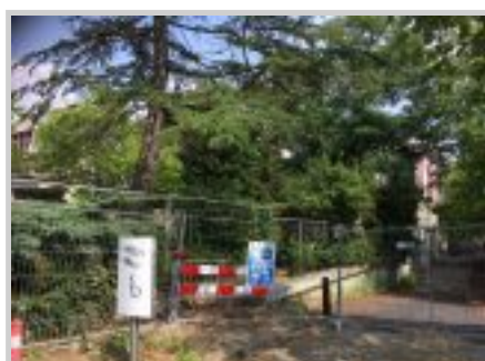
Bij het oude CB pand