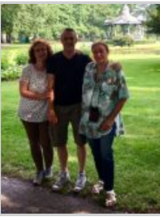
Statieportretje in Oranjepark 😊