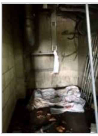
een hok wat ook als slaapplek wordt gebruikt