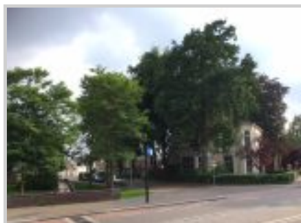
BBQ voor jongeren bij de Herberg