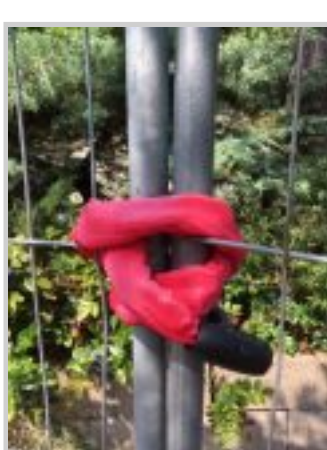
Sloten op de hekken