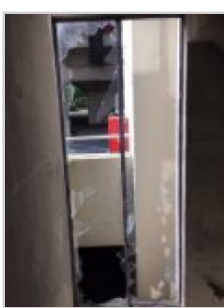
vernielingen aan CB pand