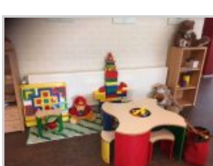
Ook aan kinderen is gedacht