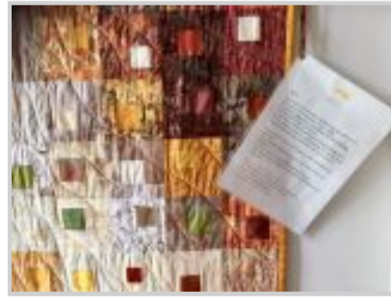
Een prachtige quilt, gemaakt door zorgvrijwilligers "de stroom van het leven". Deze hangt in de streekamer.