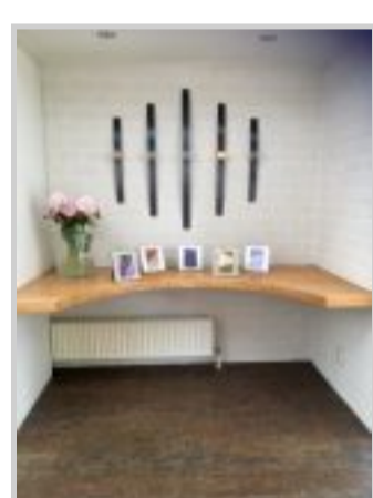
5 kamers met de namen van bloemen: als er iemand overleden is brandt er een kaarsje