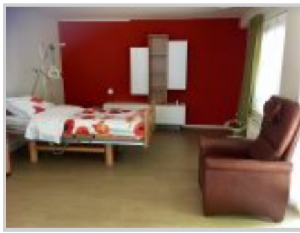
Een van de gastenkamers