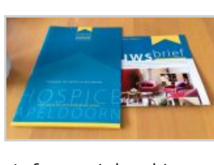
Informatieboekje en nieuwsbrief