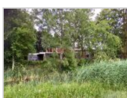
Verscholen in het groen ligt het hospice