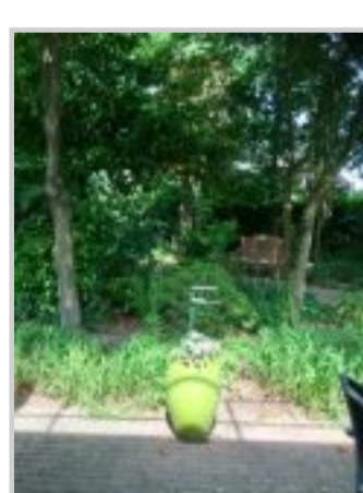
Iedere gastenkamer heeft een eigen tuintje