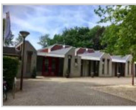
Hospice Apeldoorn: Polkastraat 5